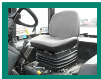
Безопасное и эргономичное сидение оператора