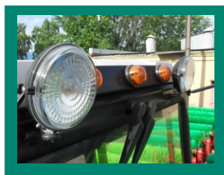
Фонари дополнительного освещения