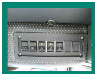
Система отопления и вентиляции кабины