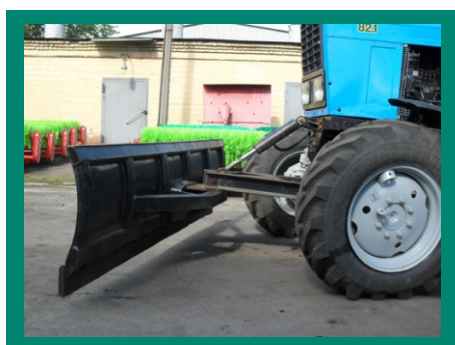
отвал коммунальный / бульдозерный