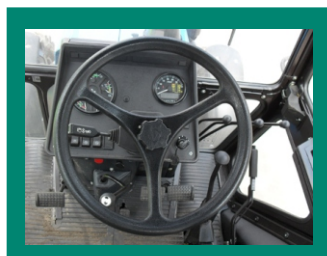
Простая и информативная панель приборов