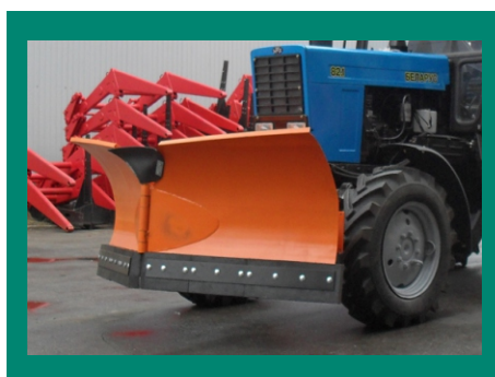
отвал с изменяемой геометрией