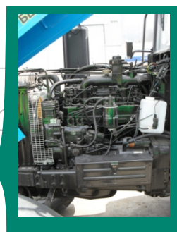
Экономичный дизель водяного охлаждения