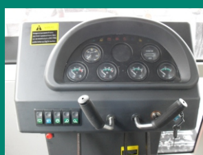
Простая и информативная панель приборов