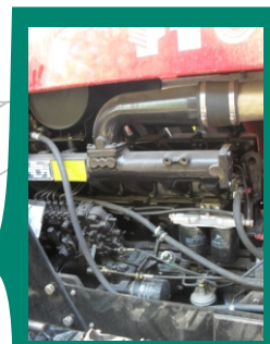
Экономичный дизель водяного охлаждения