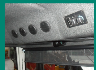
Система отопления и вентиляции кабины