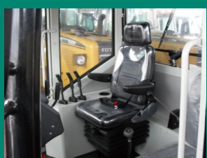
Безопасное и эргономичное сидение оператора