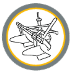
Плуги и культиваторы