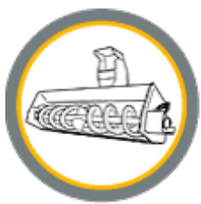
Шнекороторное оборудование для уборки снега