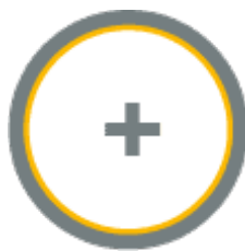
Пылесос навесной вакуумный