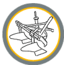
Плуги и культиваторы