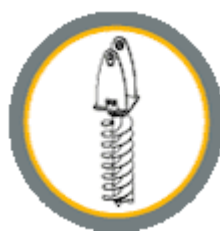
Гидравлический шнековый бур