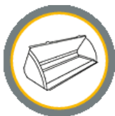
Ковши погрузочные различного назначения