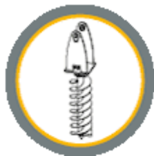
Гидравлический шнековый бур