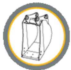
Дополнительные специальные ковши различного назначения